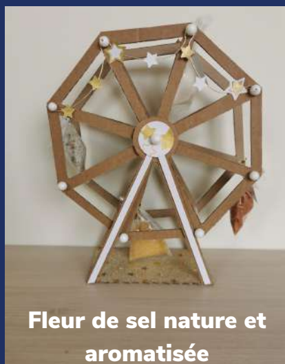
Fleur de sel nature et aromatisée