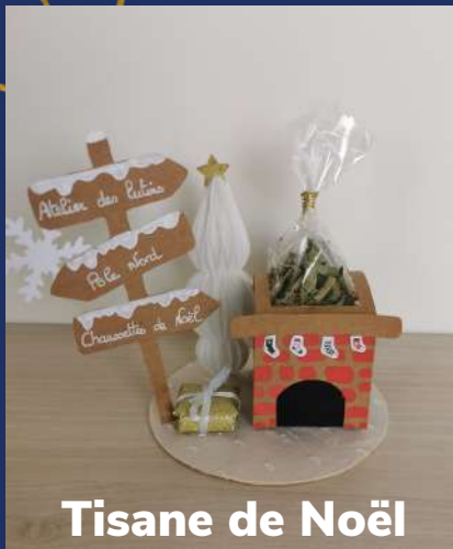
Tisane de Noël