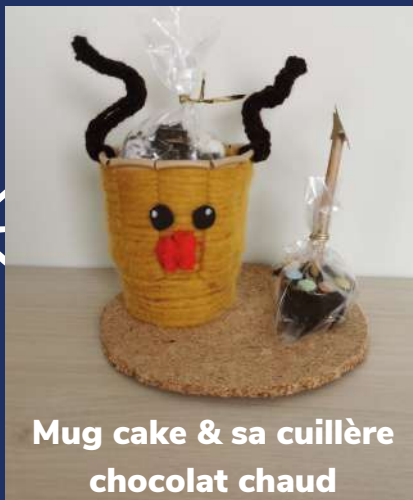
Mug cake & sa cuillère chocolat chaud