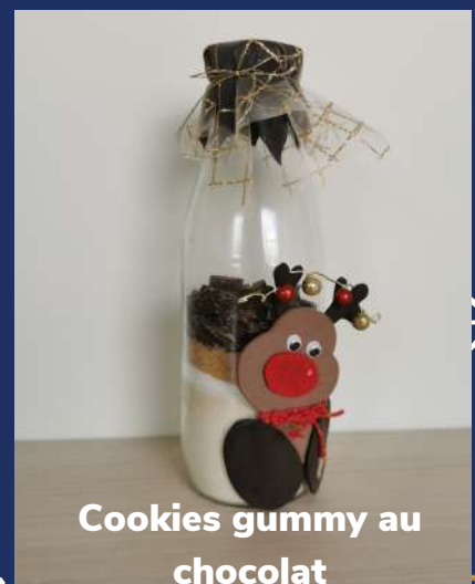
Cookies gummy au chocolat