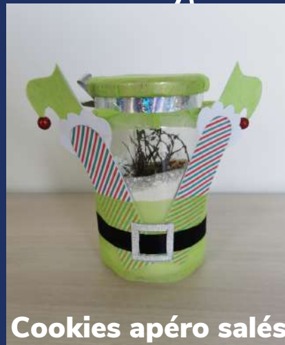
Cookies apéro salés